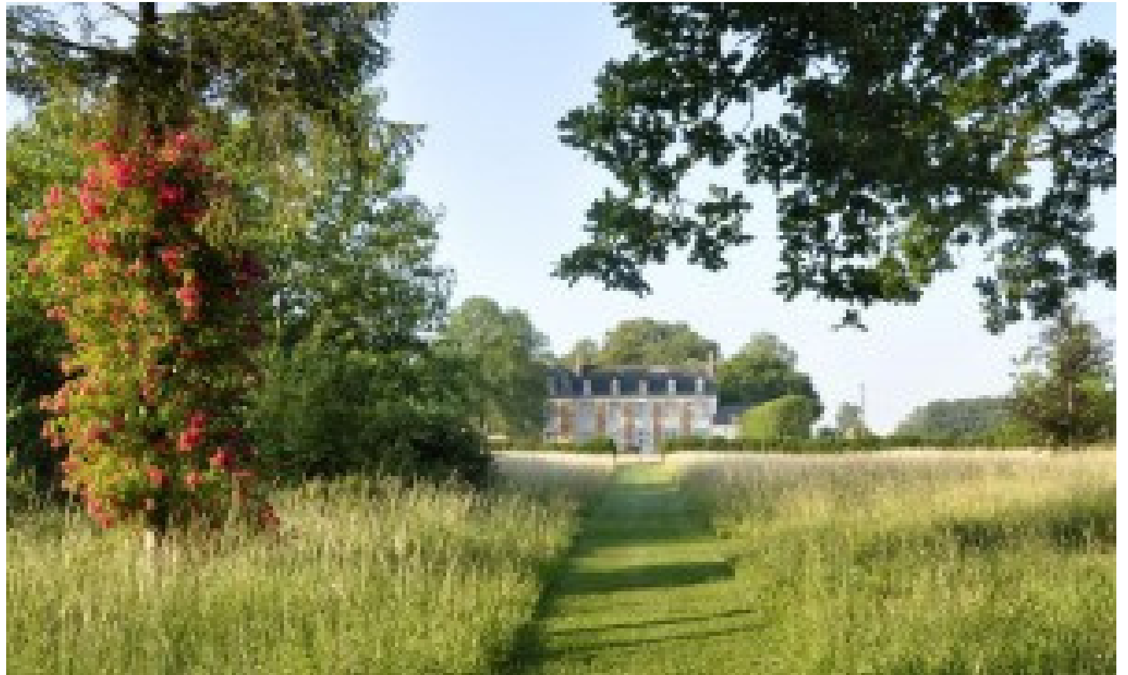
Jardins de la Javelière - Montbarrois