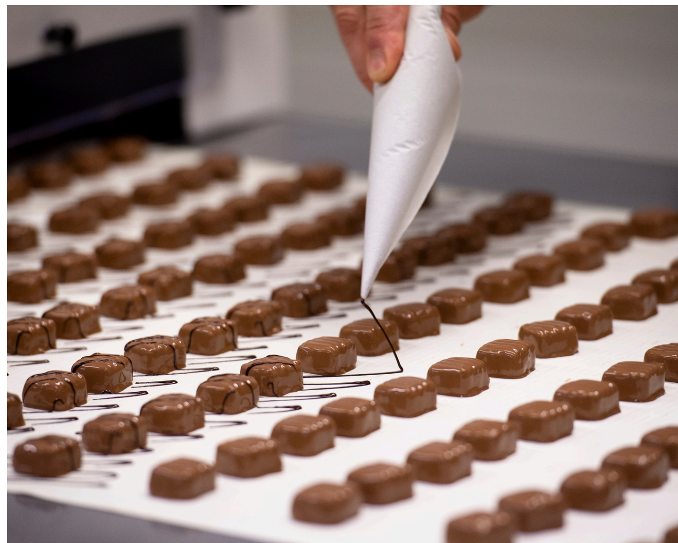
Chocolaterie Alex & Olivier - Neuville-aux-Bois