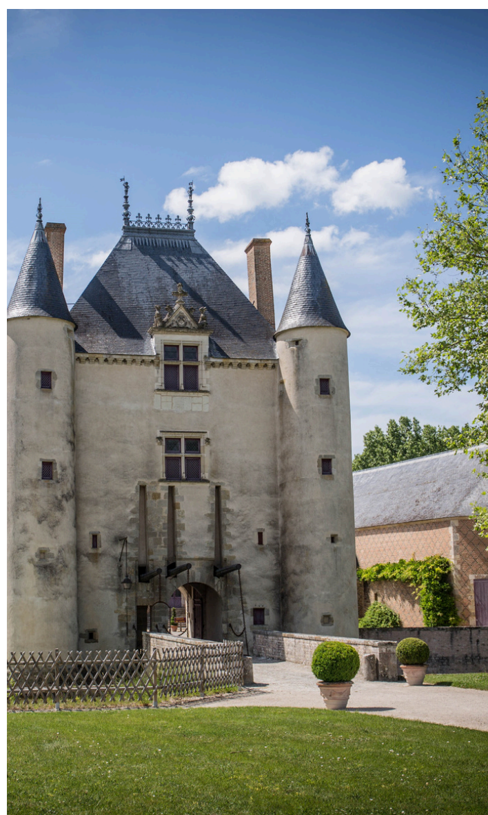
Château de Chamerolles - Chilleurs-aux-Bois

12h30 : Déjeuner dans un restaurant traditionnel